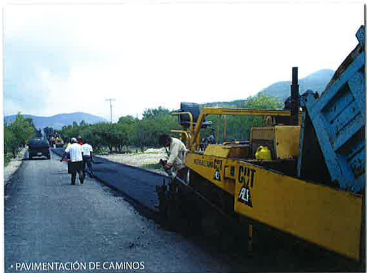
PAVIMENTACIÓN DE CAMINOS