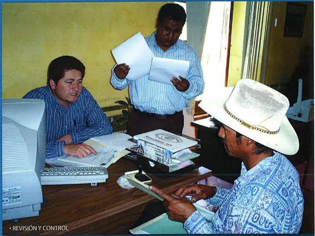
• REVISIÓN Y CONTROL