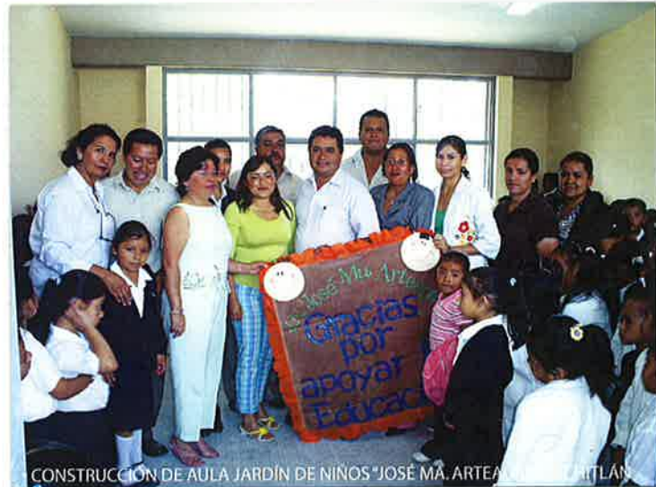
CONSTRUCCIÓN DE AULA JARDIN DE NIÑOS 'JOSÉ MA. ARTEAGA' TITLÁN