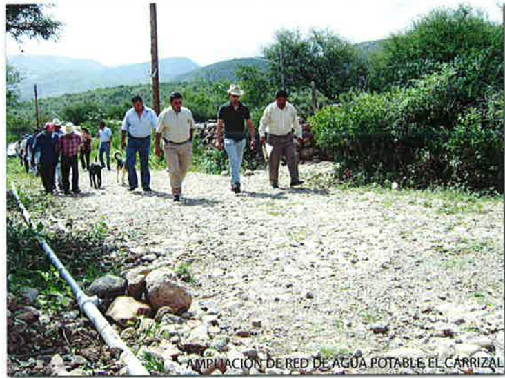
AMPLIACIÓN DE RED DE AGUA POTABLE EL CARRIZAL