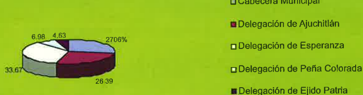
Distribución de Población Beneficiada